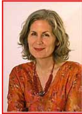
Por Kathy Newburn*

Me gustaría compartir hoy con ustedes unos pensamientos acerca del trabajo grupal. El Tibetano escribe, ampliamente, acerca de los retos que se presentan cuando se sigue el sendero espiritual y el servicio del discipulado pero, también, nos recuerda que las alegrías y compensaciones de este camino son muchas y que merece la pena el esfuerzo. Al no poder dormir la noche pasada, me puse a pensar en esas compensaciones y para mí, al menos, se hizo presente el poder estar con ustedes aquí, porque en el sentido más real de la palabra, todos somos hermanos y hermanas.