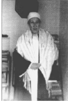
RENÉ GUÉNON (ABD AL-WAHID YAHIA)