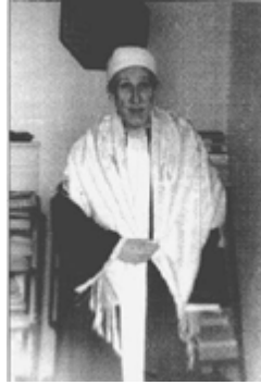
RENÉ GUÉNON (ABD AL-WAHID YAHIA)