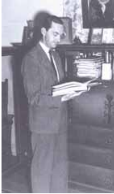
Boris de Zirkoff

(Charla dada en 1974 e impresa en Theosophy World N° 11)