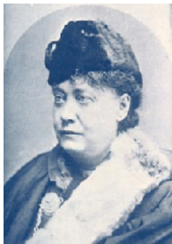
H . . . P . . . Blavatsky . . .