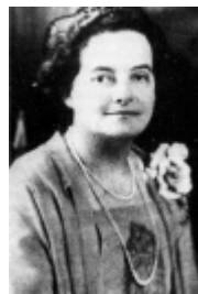
Alice A. Bailey