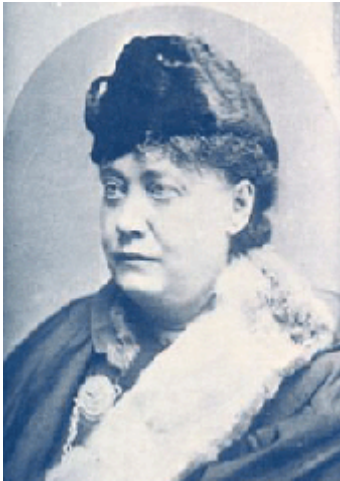
H .. P.. Blavatsky ...