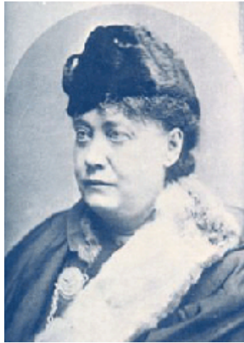
H .. P.. Blavatsky ..